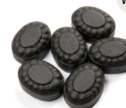
HAVSALT LÆKRIDS FU-66120