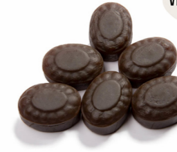
SØD LÆKRIDS FU-66121