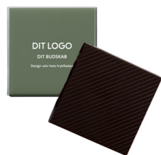
58% MØRK CHOKOLADE FU-66032