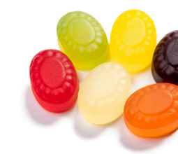
FRUGT & SØD LÆKRIDS FU-66122