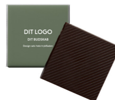
70% MØRK CHOKOLADE FU-66035