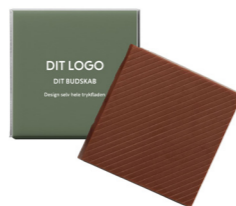
LYS CHOKOLADE m. karamel FU-66034