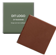
35% LYS CHOKOLADE FU-66033